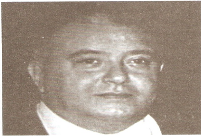
Mário Ferreira dos Santos.

O filósofo brasileiro Mário Ferreira dos Santos (1907-1968) explica que a diferença vem com a comparação. Quando olhamos e dizemos: “Isso não é um gato”, ao mesmo tempo estamos dizendo: “Isso não é um cachorro, nem uma mesa, nem um sorvete”. Ou seja, tudo é diferente de tudo, menos de si mesmo. Você é igual a você, mas diferente de todas as outras coisas.